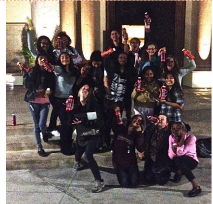
GIRLS en la visita a USD para ver HONOR DIARIES.